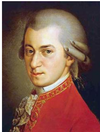
композитора и его музыку